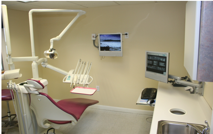
Dotare cabinete stomatologice

Personalul medical de specialitate care va desfășura activitatea în cadrul cabinetelor va fi evaluat de către Asociația AHAVA.